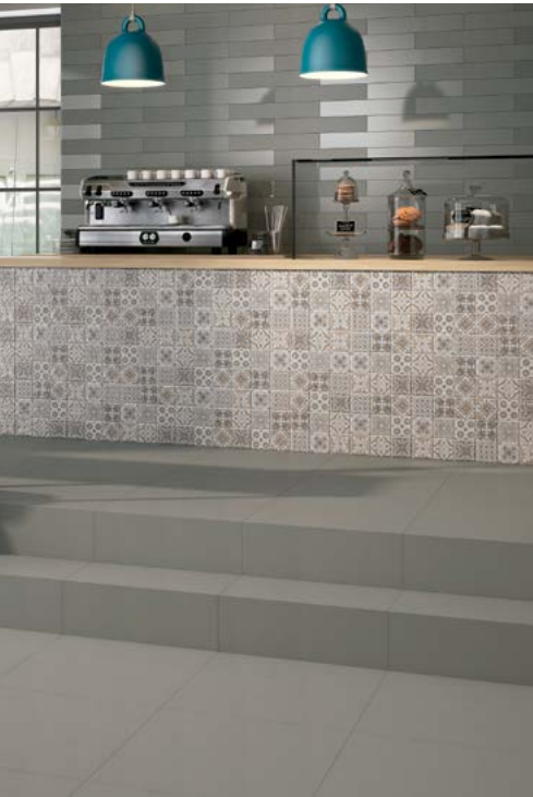
Tabla Técnica | Technical Chart | Scheda Tecnica

Porcelánico No Esmaltado | Unglazed Porcelain | Porcellanato No Smaltato