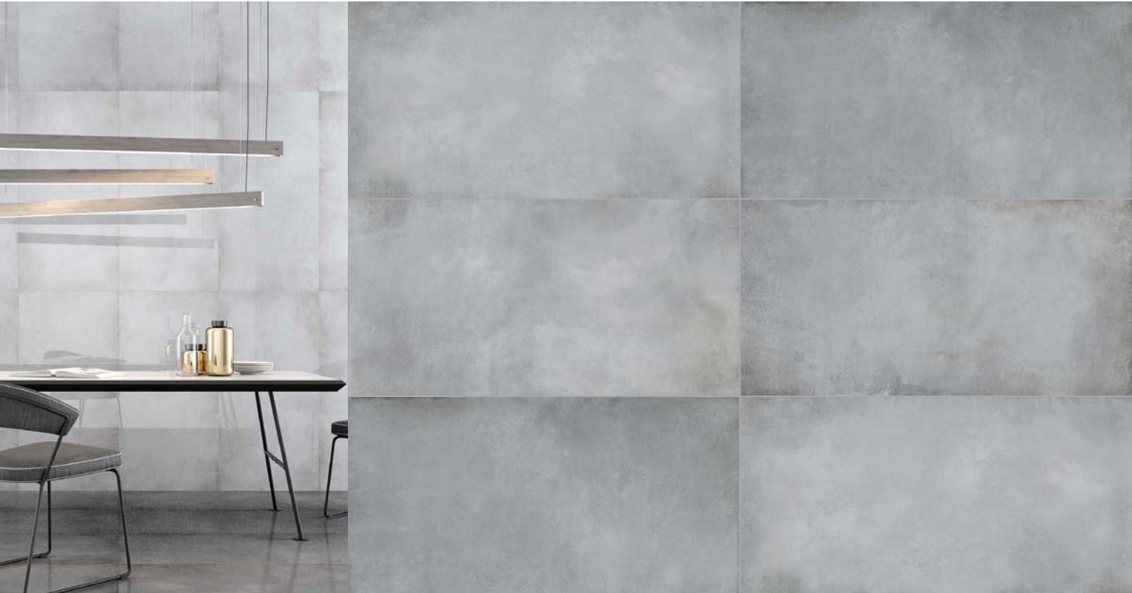
Tabla Técnica | Technical Chart | Scheda Tecnica

Porcelánico Esmaltado | Glazed Porcelain | Porcellanato Smaltato