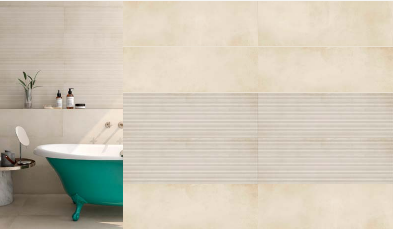
Tabla Técnica | Technical Chart | Scheda Tecnica

Pasta Blanca | White Body | Pasta Bianca