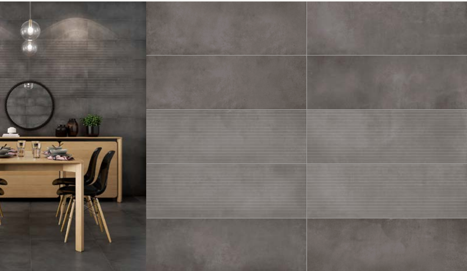
Tabla Técnica | Technical Chart | Scheda Tecnica

Pasta Blanca | White Body | Pasta Bianca