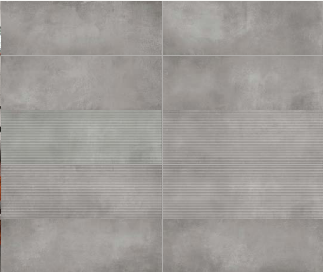
Tabla Técnica | Technical Chart | Scheda Tecnica

Pasta Blanca | White Body | Pasta Bianca